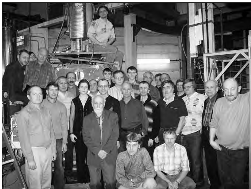
Группа КМД-3.

На сегодняшний день оно является самым точным, по результатам этой работы готовится журнальная публикация.