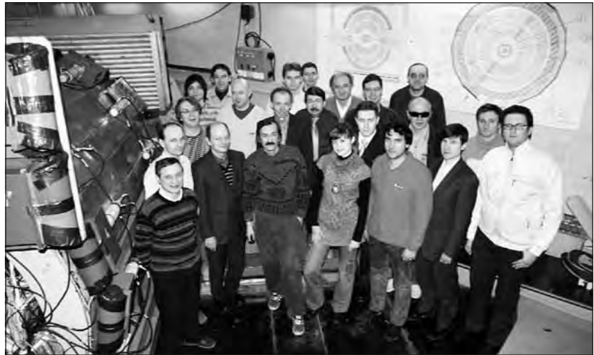
Группа СНД, декабрь 2009 г.

Продолжалась обработка данных измерений СНД на ВЭПП-2М. Из наиболее значи-