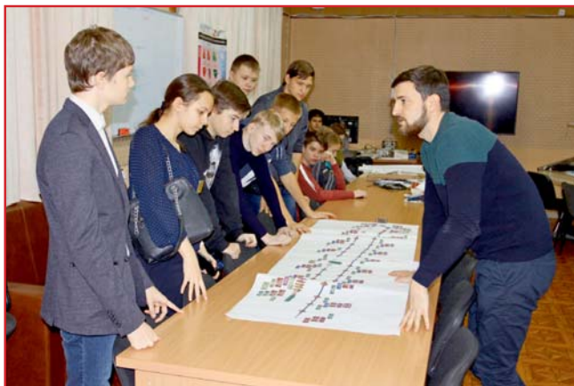
Начало на стр. 1.

нию движения частиц был получен во время работы по реализации этой программы. «И что не менее важно, — подчеркнул докладчик, — в этой работе принимало участие много студентов, которые сейчас продолжают эту работу уже в качестве сотрудников ИЯФа».