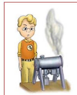
Рисунок Д. Чекменёва.

использованием ЭЛВ для новых технологических применений, защищены в организациях Новосибирска, Томска, Москвы, Южной Кореи.